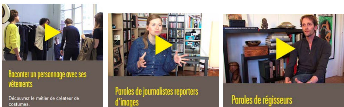
Capture d'écrans des vidéos sur les métiers

Le site internet de la CPNEF de l'audiovisuel se veut un espace ressources, avec des fiches métiers, des vidéos, un répertoire des formations et la consultation de toutes les études réalisées dans le cadre de l'Observatoire des métiers.